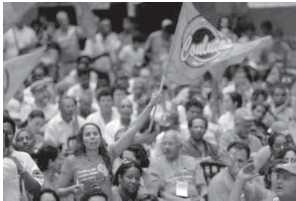
ENCONTRO NACIONAL: debates, defesas e votações democráticas

conta do plenário. Era perceptível que cada uma das delegadas, observadoras, convidadas estavam mais fortalecidas para travar suas lutas no dia a dia. As delegações começavam a se organizar para voltar aos seus estados com a certeza de que aqueles três dias intensos se transformariam em força e persistência para enfrentar a luta cotidiana.